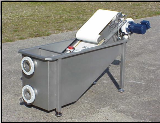
AL-2 Båndfilter mod: 1,3 monteret med presbånd.