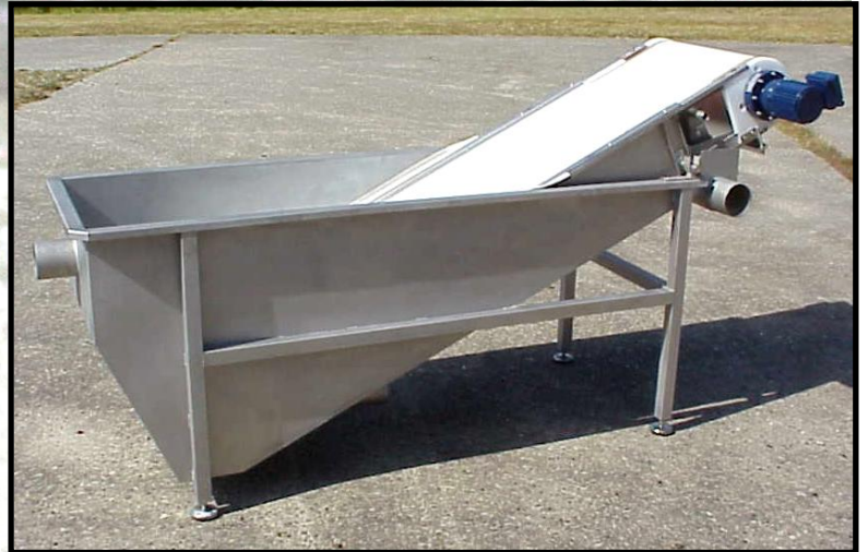
AL-2 Båndfilter mod: 2,1 monteret i kompakt kar.