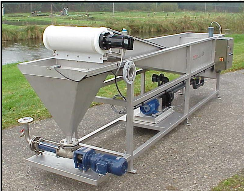
AL-2 Båndfilter mod: 3,6 monteret i kar med slamtragt og pumper m.m.